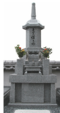
縁之塔 (えにしのとう)